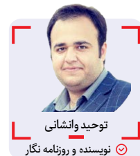
توحید وانسانی نویسنده و روزنامه نگار