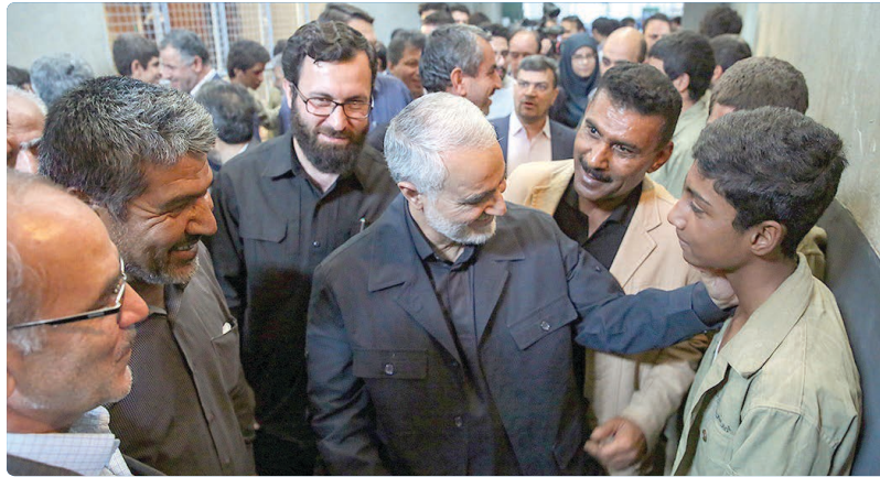
امضاء: قاسم سلیمانی

احمد یوسف زاده که خود اسارتی هشت ساله را در کنار دیگر رفقا تجربه کرده است در ادامه گفت و گو از کوتاه نوشته های سخن به میان می آورد که ابتدای کتاب آن بیست و سه نفر جا خوش کرده است. او گفت: بعد از این که حاج قاسم ساعتی را در کنار ما ماند و با همان خوش رویی و محبتی که در سیمایش رخ نمایی می کرد به همه ما روحیه داد، هنگام رفتن، یکی از زاده ها یک جلد از کتاب آن بیست و سه نفر را آورد و خواست شهید سلیمانی یادداشتی برایش بنویسد. حاج قاسم این جمله قشنگ را پشت جلد کتاب بالای عکس من که با دوربین یک خبرنگار در زندان استخبارات بغداد گرفته بود؛ نوشت: «جان من فدای شما که جانتان را فدای اسلام عزیز کردید، امضا - قاسم سلیمانی».