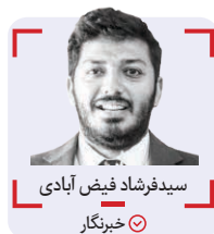
سیدفرهاد فیض آبادی خبرنگار

مراسم تجلیل از فعالان حوزه ورزش بانوان، روز گذشته با حضور «مسعود سلطانی‌فر» - وزیر ورزش و جوانان - و «معصومه ابتکار» - معاون رئیس جمهور در امور زنان و خانواده - برگزار شد.