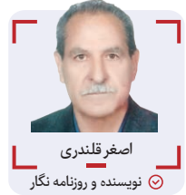
اصغر قلندری نویسنده و روزنامه نگار