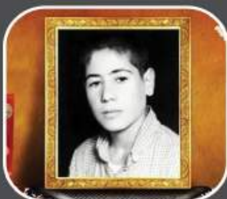
شهید بهمن بیگ زاده