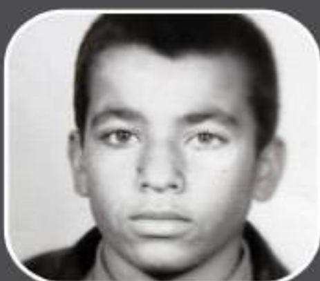
شهید ناصر رازی