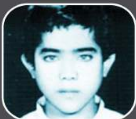
شهید حسین کیانی نیا