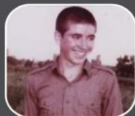
شهید یعقوبعلی داغی