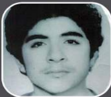
شهید محمد حسین ۱۳ ساله ای که راه امام حسین را فهمیده