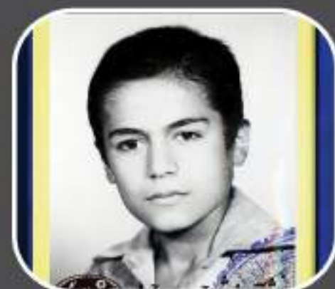
شهید حسن محمدرحیمی ها