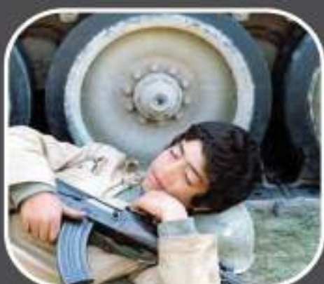
شهید علیرضا محمودی پارسا