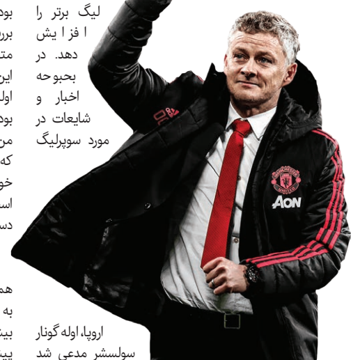
اروپا، اوله گونار سولسشر مدعی شد

لیگ برتر را افزایش دهد. در بحبوحه اخبار و شایعات در مورد سوپرلیگ